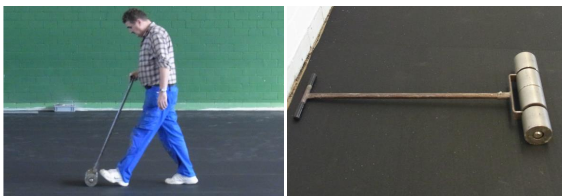
Abrollen des Belages mit einer Anpresswalze

Nach der Verklebung des Belages, allerdings bevor der Kleber komplette ausgehärtet ist, mit einer Walze Anpressdruck ausüben um kleine Bläschen unter der Bahn auszudrücken.