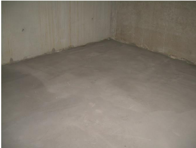
glatter, geeigneter Untergrund aus Betonestrich

Als Untergrund eignen sich asphaltierte und betonierete Flächen sowie ein gegossener Estrichboden. Der Untergrund muss eben, fest, trocken, sauber und frei von Verschmutzungen und Rissen sein, die das Verkleben beeinträchtigen können.