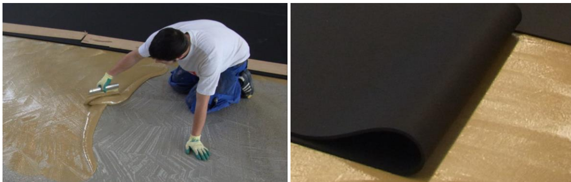
Kleberauftrag auf den sauberen Untergrund; ausrollen der Bahnen in das Kleberbett

Den Kleber mit einem Zahnpachtel gleichmäßig auf der Fläche verteilen auf der die Rolle ausgelegt wird. Für die Verlegung von SPORTEC® giga ist ein geeigneter 2-Komponenten Polyurethan Kleber (z. B. SPORTEC 700 2K-PU Kleber) und ein Zahnpachtel mit der vom Kleberhersteller empfohlenen Zahnung zu verwenden. Anschließend wird die Rolle in das Kleberbett ausgerollt. Hierbei die Abluftzeit / Setzzeit des verwendeten Klebers beachten.