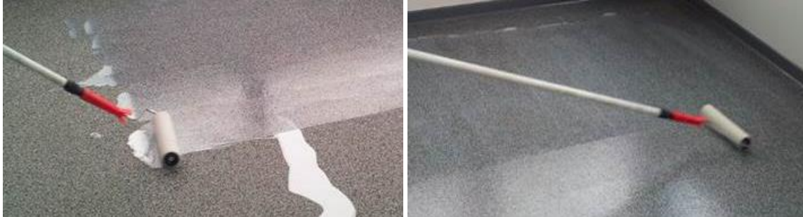
Versiegeln der Oberfläche