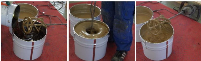
Anrühren des 2-Komponenten PU-Klebers

Der Bodenbelag wird in Rollen geliefert, welche 1-2 Tage bei einer Temperatur von 15°C bis 25°C zur Akklimatisierung dort gelagert werden müssen, wo sie verlegt werden sollen. Am Vortag der Installation den Bodenbelag lose ausrollen damit sich die einzelnen Bahnen entspannen. Vor der Installation sind die beiden Komponenten des Klebers zu mischen. Den gesamten Klebereimerinhalt direkt nach dem Mischen gleichmäßig auf die vorbereitete Installationsfläche gießen (ca. 0,7 kg/m 2 bei SPORTEC 700 2K-PU Kleber ) so dass keine Kleberreste im Eimer zurückbleiben.