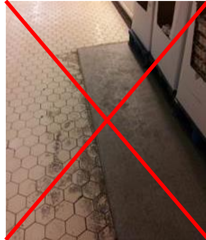
nicht geeigneter Bodenbelag